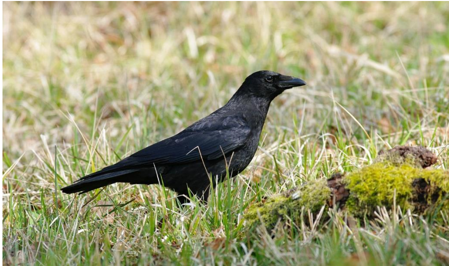
Grand corbeau (l'observation la plus extraordinaire à mon poste de nourrissage, jusqu'à 7, mais ont disparu fin février)