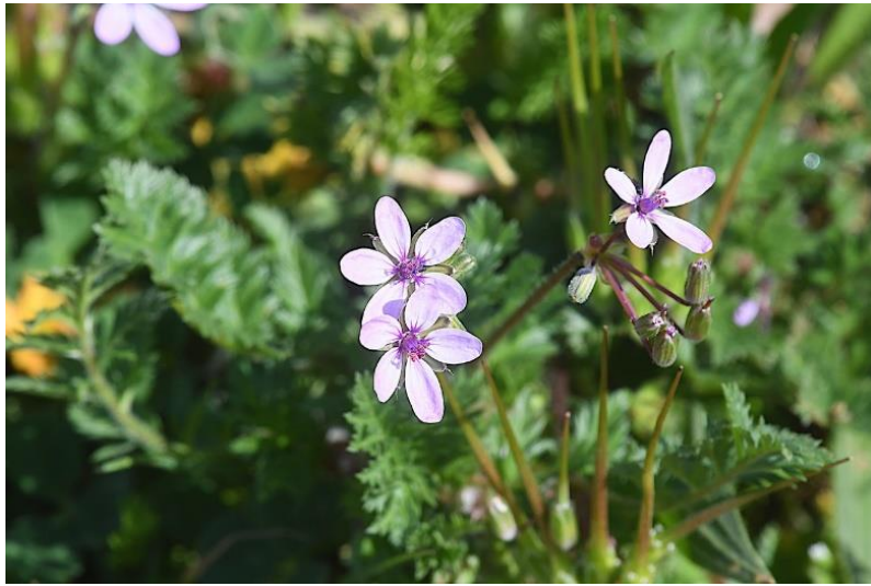
Erodium cicutarium (bec-de-grue)