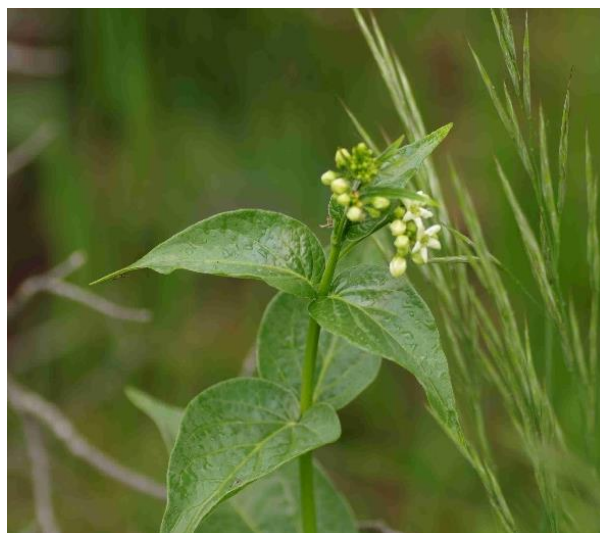
Vincetoxicum hirundinaria (Dompte venin)