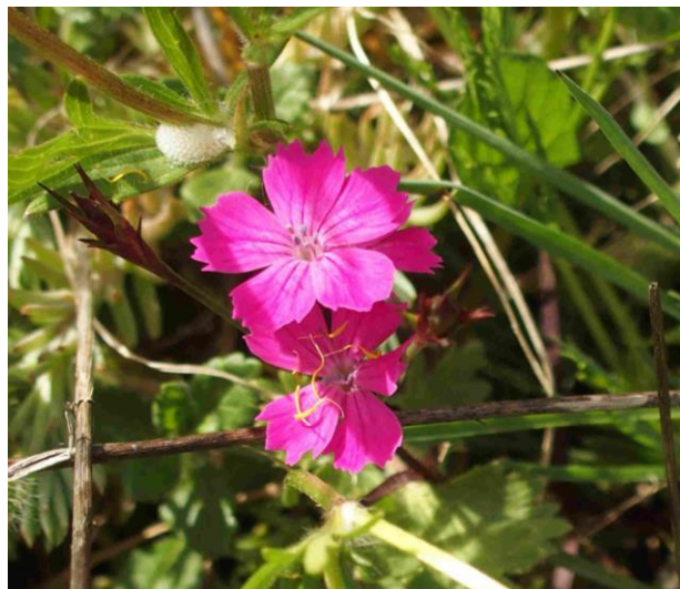
Dianthus carthusianorum (Œillet des chartreux)