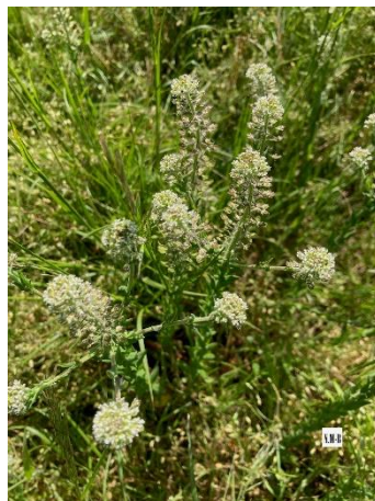
Lepidium heterophyllum (Passerage champêtre)