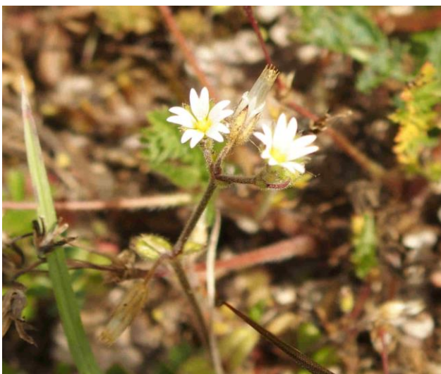
Stellaria media (stellaire intermédiaire)