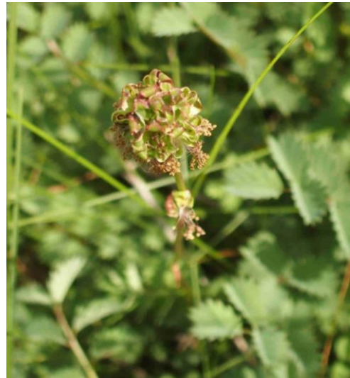
Poterium sanguisorba (Petite pimprenelle)