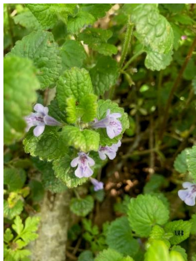
Glechoma hederacea (Lierre terrestre)