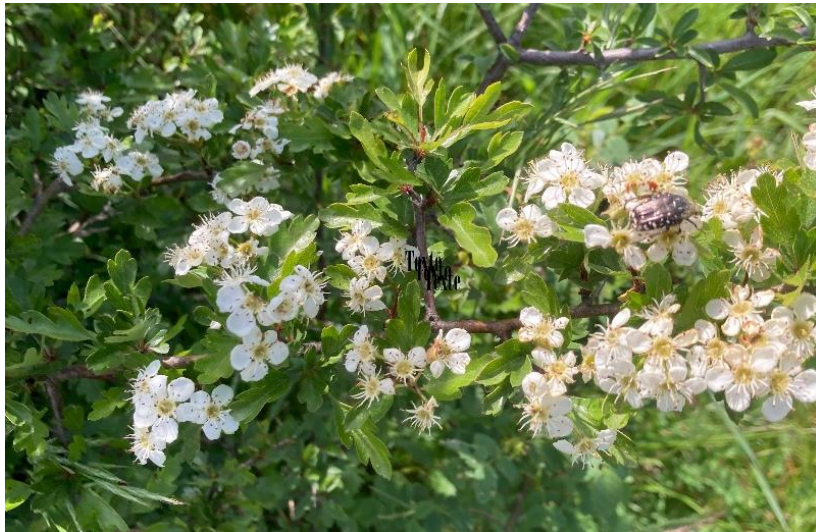
Crataegus monogyna (aubépine)