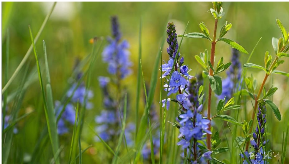
Veronica officinalis (Véronique officinale)