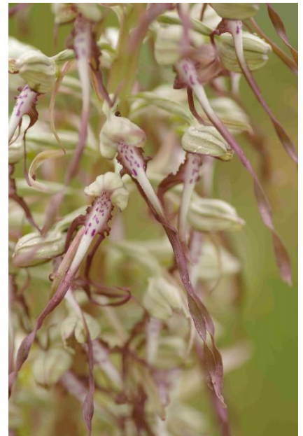
Himantoglossum hircinum (Orchis bouc)