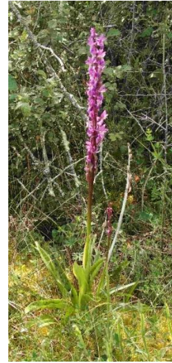
Orchis maculata = Dactylorhiza maculata = Orchis tacheté