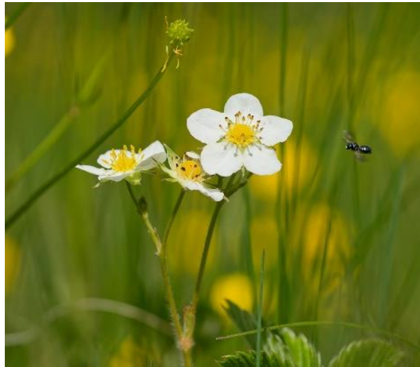
Fragaria vesca (Fraise des bois)