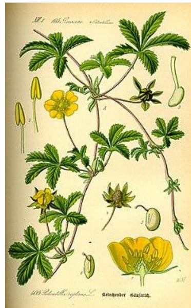
Potentilla reptans (Potentille dorée ou rampante)

feuilles divisées en 5 folioles dentées (parfois 7), fleurs comportant 5 sépales étroits et 5 pétales jaunes deux fois plus longs que les sépales