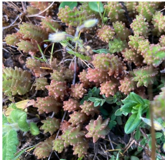
Sedum sexangulare (Orpin doux)