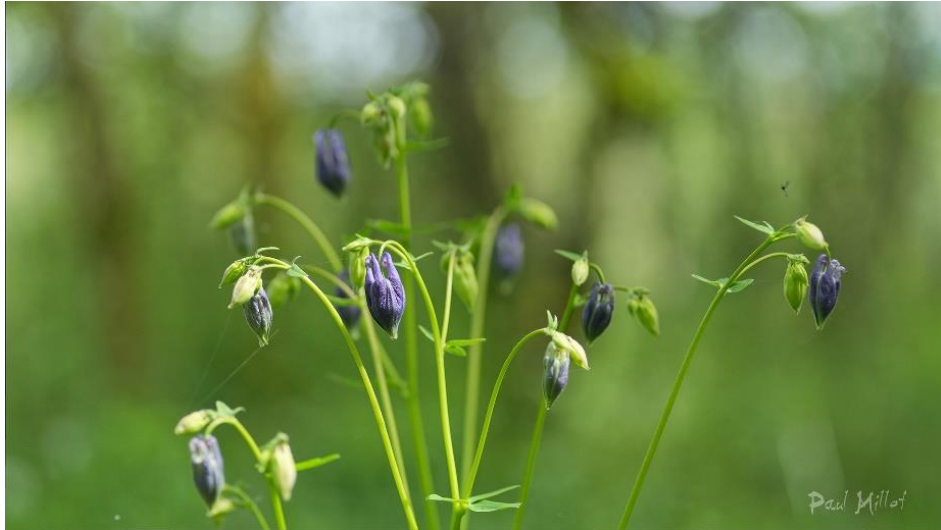
Aquilegia vulgaris (Ancolie commune)