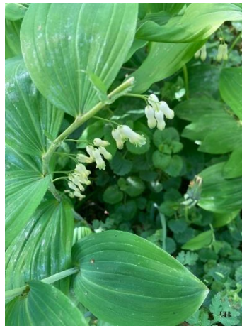
Polygonatum multiflorum (Sceau de Salomon)