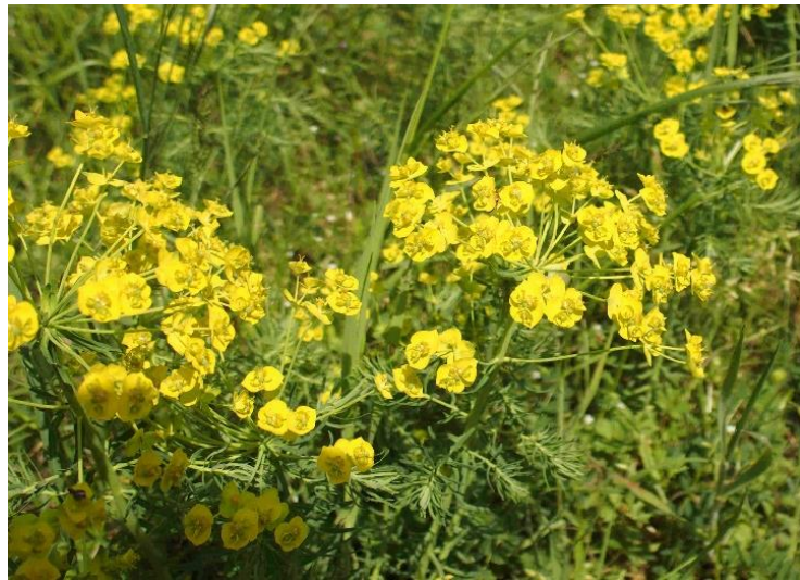
Euphorbia cyparissias (Euphorbe petit cyprès)