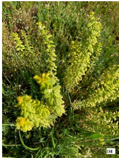
Galium mollugo (Gaillet croisette)