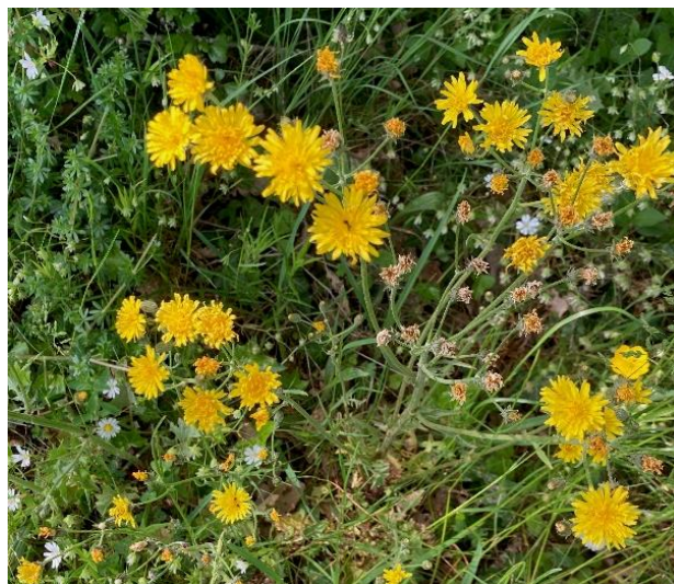
Crepis setosa (Crepis hérissée)