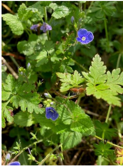
Veronica chamædrys (Véronique petit chêne)